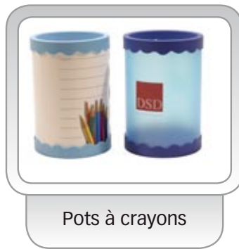
Pots à crayons