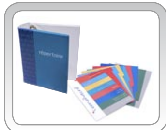
Classeur + répertoire