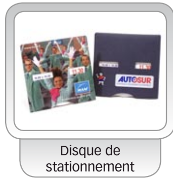
Disque de stationnement