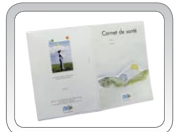
Carnet de santé