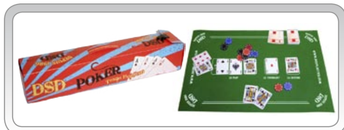
Jeux de Poker complet ou tapis uniquement