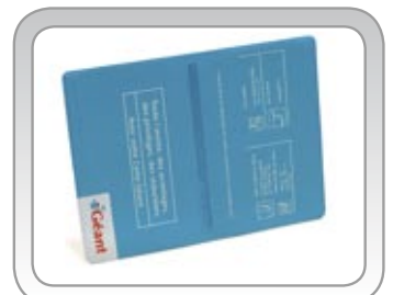
Porte cartes fidélité